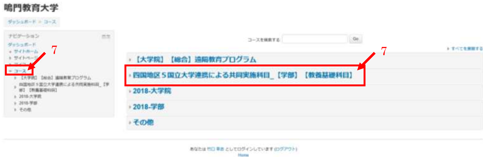
図 4.Moodle ログイン後の画面