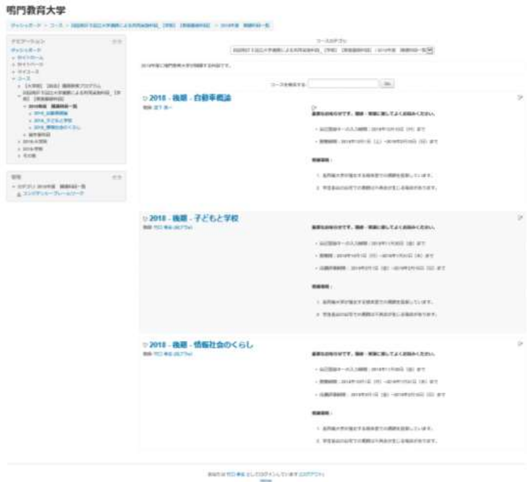
図 6. 開講科目一覧（例は 2018 年後期）

10. 開講される科目の一覧が表示されますので、希望される科目を選択してください。