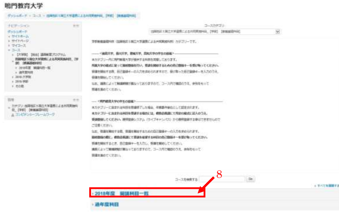
図 5. 学部教養基礎科目（四国地区 5 国立大学連携による共同実施科目）カテゴリ一覧