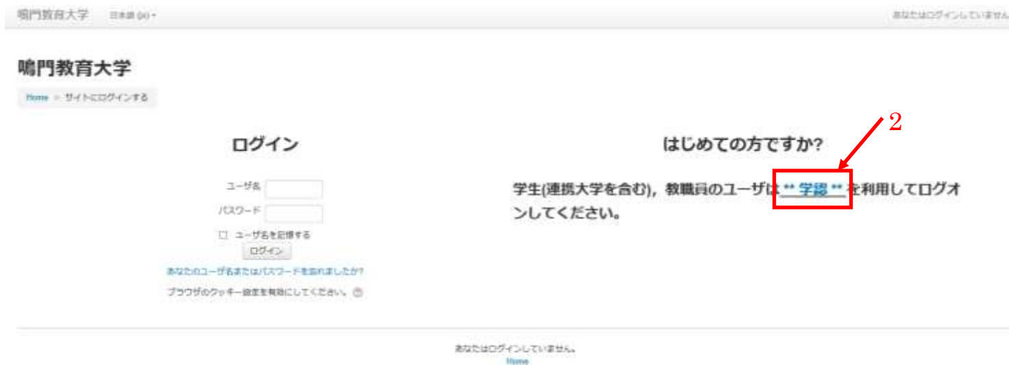
図 1. Moodle ログインのための画面